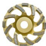
Dia-Schleifteller UNIVERSAL gold d= 125 mm Z37128000