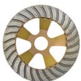
Diamant-Schleifteller Beton gold d= 125 mm Z37126000